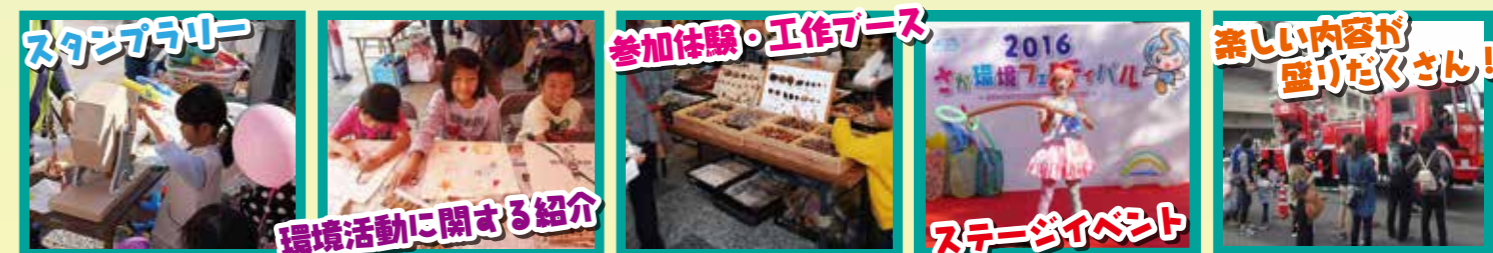
●写真はイメージです。(昨年度のもの利用しています) ※天候などにより内容の変更、または中止になる場合があります。

■主催/さが環境コラボ (事務局:NPO 法人 温暖化防止ネット)、佐賀県立森林公園指定管理者 (葉隠緑化建設・佐賀広告センターグループ) ■共催/佐賀市 ■後援/NHK 佐賀放送局、サガテレビ、佐賀新聞社、西日本新聞社、朝日新聞社、読売新聞西部本社、毎日新聞社、NBC ラジオ佐賀、エフエム佐賀、ぶんぶんテレビ 佐賀県「ストップ温暖化」県民運動推進会議、佐賀市環境保健推進協議会、佐賀市地域婦人連絡協議会